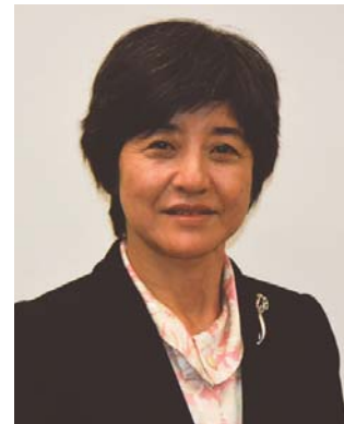
消費者庁長官 板東 久美子氏 プロフィール

東京大学法学部卒業 出身地 徳島県 昭和52年 文部省大学局大学課 平成4年 文部省大臣官房人事課調査官 平成4年 同高等教育局視学官(米国国立科学財団(NSF)派遣) 平成6年 同学術国際局国際企画課教育文化交流室長 平成7年 同生涯学習局婦人教育課長 平成8年 文化庁文化部著作権課長 平成10年 秋田県副知事 平成12年 文部省教育助成局財務課長 平成13年 文部科学省初等中等教育局財務課長 平成13年 同高等教育局高等教育企画課長 平成15年 同大臣官房人事課長 平成16年 同大臣官房審議官(大臣官房担当) 平成18年 内閣府男女共同参画局長 平成21年 文部科学省生涯学習政策局長 平成24年 同高等教育局長 平成25年 文部科学審議官 平成26年 文部科学省大臣官房付 平成26年 消費者庁長官